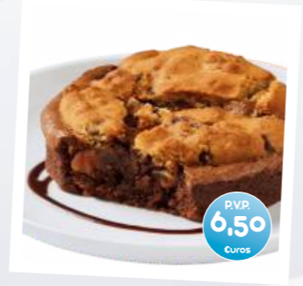
Brookie con Helado (Brownie y Cookies)