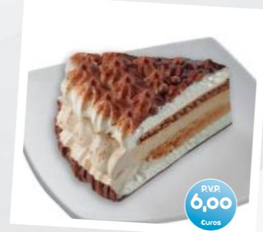
Tarta Helada Romántica Chocolate y Caramelo