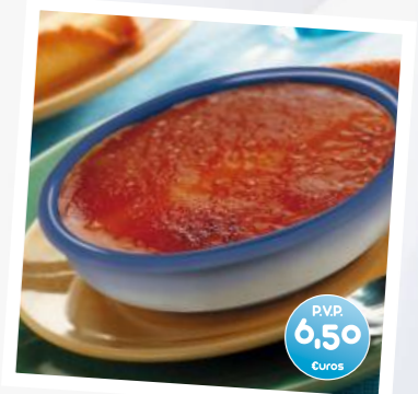
Crema Catalana Helada