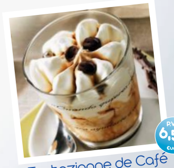
Tentazione de Café