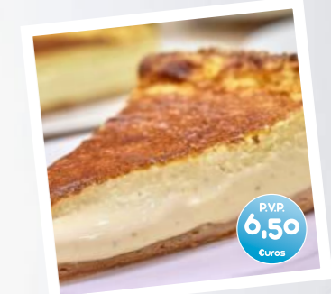
Tarta de queso al estilo vasco