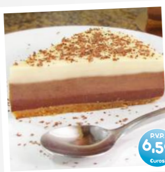
Tarta Tres Chocolate (Three Chocolates Cake)