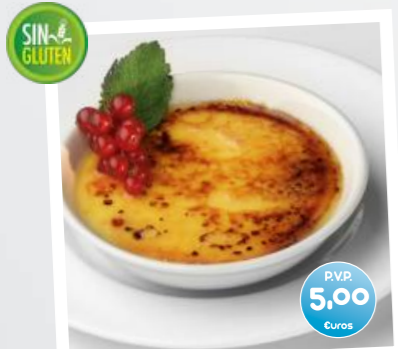
Crema Catalana (Creme Catalane)