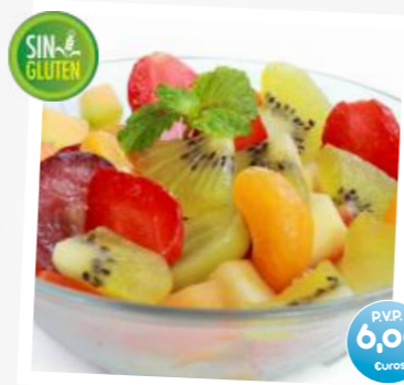
Ensalada de Frutas (Macedoine de Fruits) (Fresh Fruits Salad) (Obatzalat)