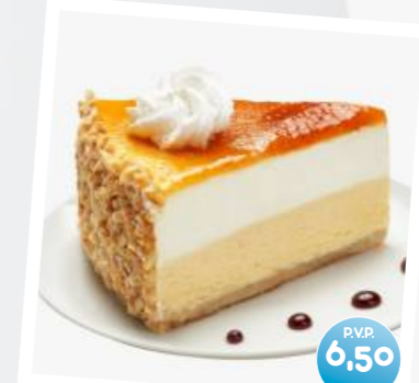
Tarta al Whisky