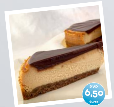
Tarta de Queso con chocolate