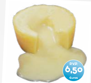
Coulant Chocolate blanco