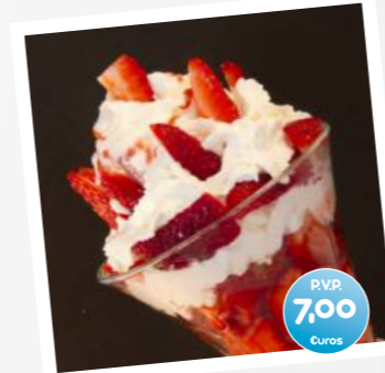
Fresas con Nata (Fraises a la creme) (Strawberry and Whipped Cream)