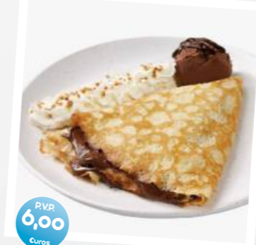
Crepe con Nutella, chocolate caliente, nata y helado Crepe with Nutella, hot chocolate, cream and ice cream