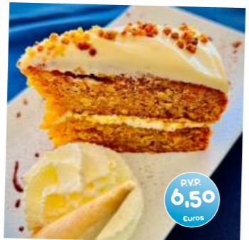
Tarta de Zanahoria con Nata (Carrot and Cream Cake)