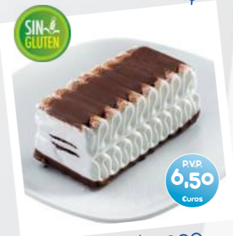
Mini Comtessa Helado de Nata y Lágrimas de Chocolate