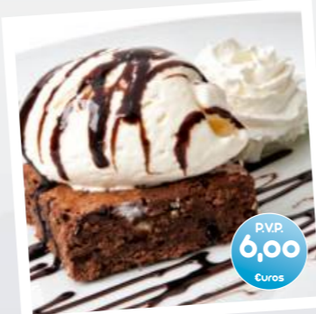
Brownie de Chocolate con helado