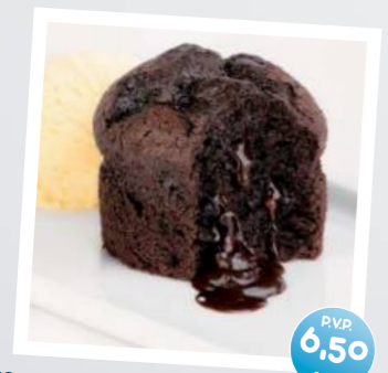
Magdalena de Chocolate con Helado