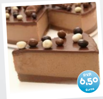
Tarta de Kinder y Chocolate