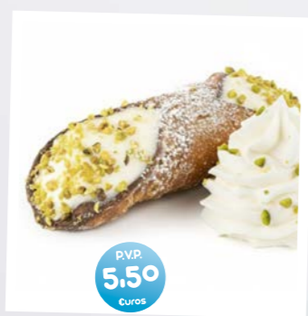
Cannoli relleno de Ricotta (Cannoli filled with Ricotta)