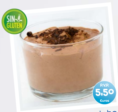
Mousse de Chocolate