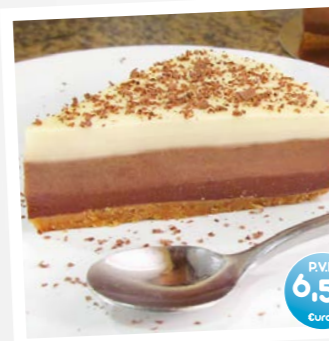
Tarta Tres Chocolates (Three Chocolates Cake)