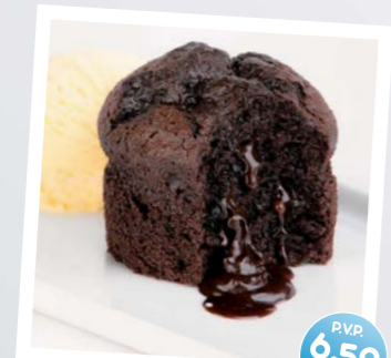
Magdalena de Chocolate con Helado