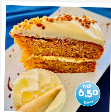
Tarta de Zanahoria con Nata (Carrot and Cream Cake)