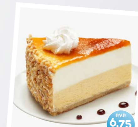
Tarta al Whisky