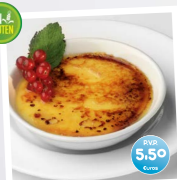
Crema Catalana (Creme Catalane)