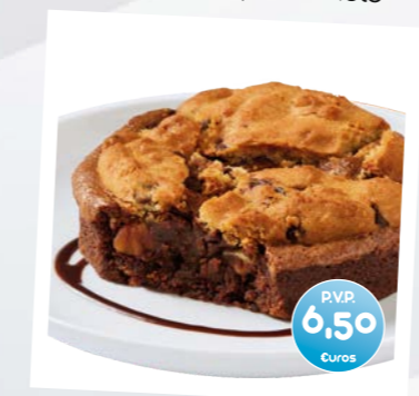
Brookie con Helado (Brownie y Cookies)