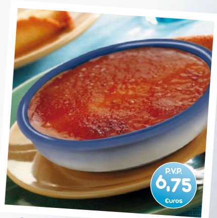
Crema Catalana Helada