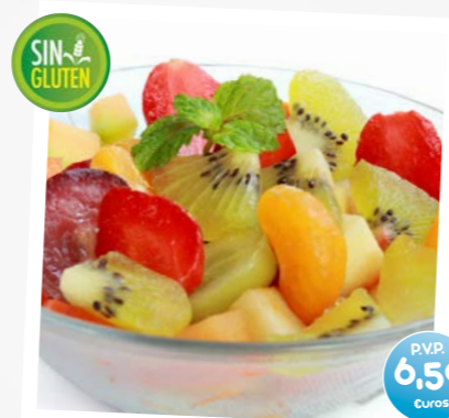
Ensalada de Frutas (Macedoine de Fruits) (Fresh Fruits Salad) (Obatzalat)