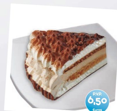
Tarta Helada Romántica Chocolate y Caramelo