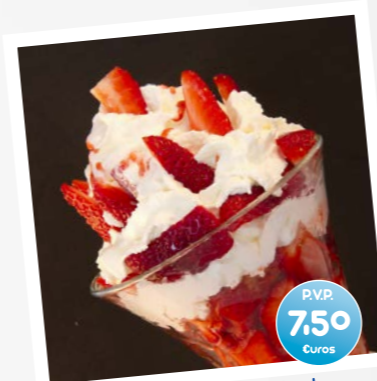
Fresas con Nata (Fraises a la creme) (Strawberry and Whipped Cream)