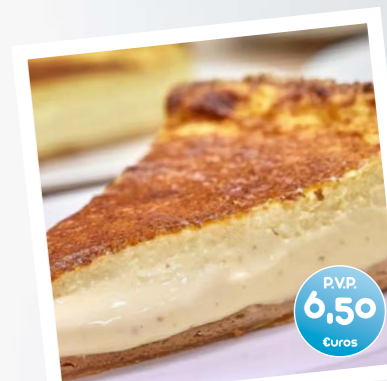
Tarta de queso al estilo vasco