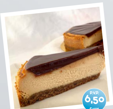
Tarta de Queso con chocolate