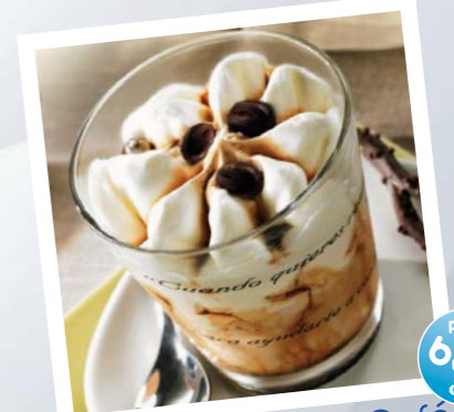
Tentazione de Café