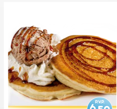
Pancakes con Helado