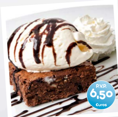
Brownie de Chocolate con helado