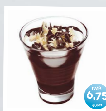
Tentazione panna e cioccolato