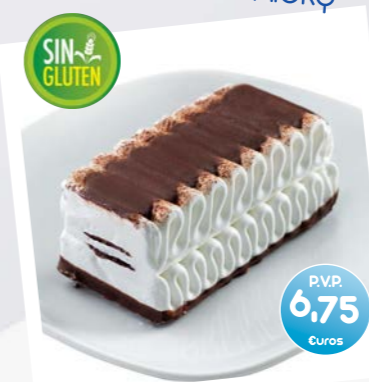
Mini Comtesse Helado de Nata y Lágrimas de Chocolate